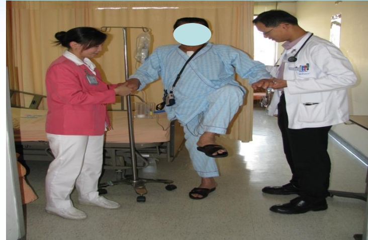
個別床邊指導及訓練