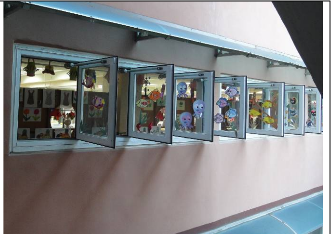
琳瑯滿目的長者作品