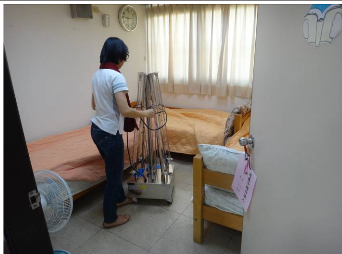
臥室休息區及定期消毒