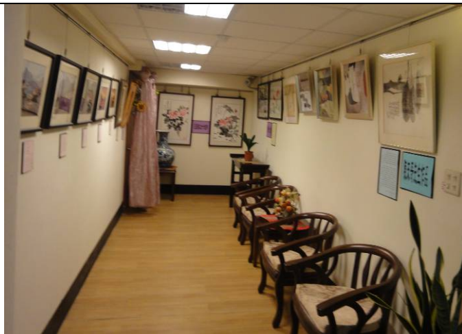
長者作品聯展專區