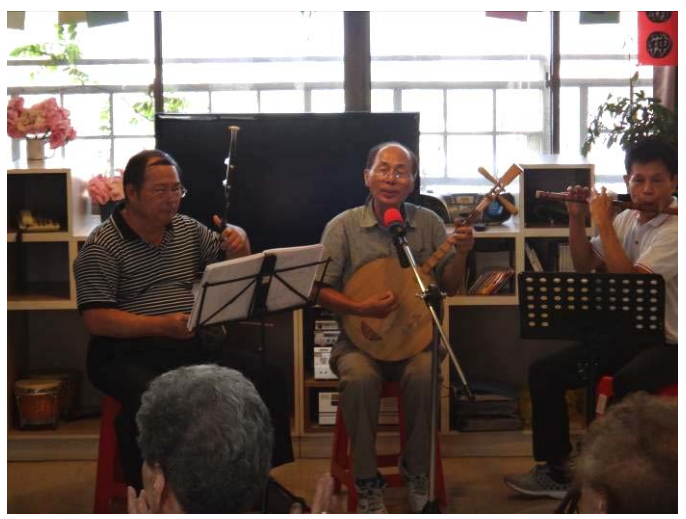
街頭藝人受邀表演