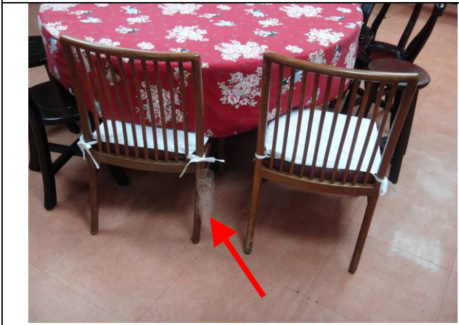
貼心設計～座椅環保拐杖架