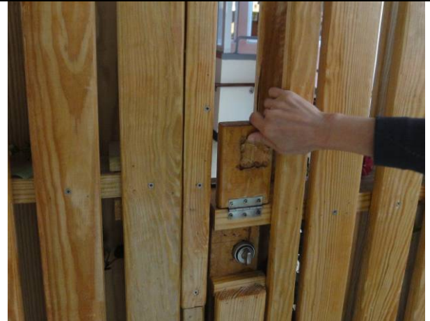
日照中心雙道門禁管控