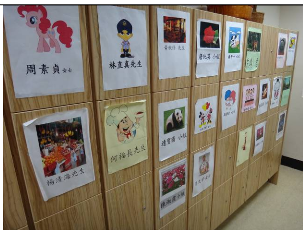
日照中心個別性置物櫃